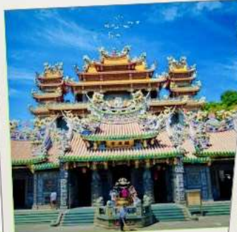
วัดกวนตู่