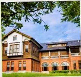
พิพิธภัณฑน์น้ำพุร้อนเป่ย์โถว