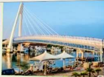
สะพานคู่รักตั้นส่วย