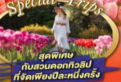
สุดพิเศษ กับสวนดอกทิวลิป ที่จัดเพียงปีละหนึ่งครั้ง