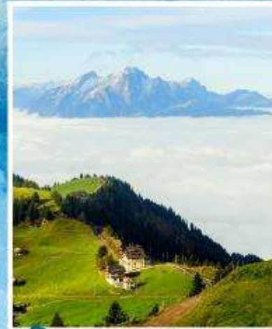
RIGI KULM Queen of the Mountains