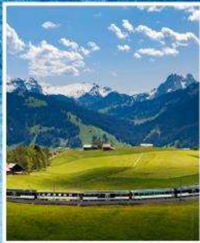
GOLDEN PASS LINE Montreux-Zweisimmen