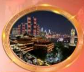
มือตำราอาหารวีโวลีกส์ล้าน