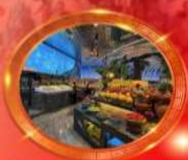
มือพิเศษ บุฟเฟต์นานาชาติ