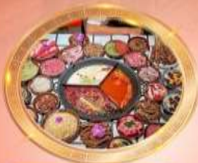
บุฟเฟต์หม้อไฟลงซิ่ง