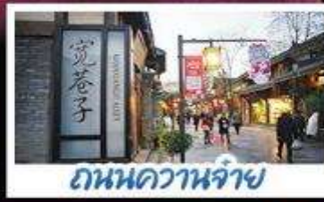
ถนนควานจ้าย