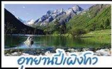
อุทยานปี่เผิงโกว

ภูเขาลี้ดรุณี อุทยานจิวจ้ายโกว นั่งรถไฟความเร็วสูง น้ำพุไม้ไฟตักSKP อุทยานปี่เผิงโกว วัดต้าฉือ ถนนโบราณชอยกวางชอยแคม ช้อปปิ้งถนนไท่กู่หลี่ + ถนนชุนซีลู่