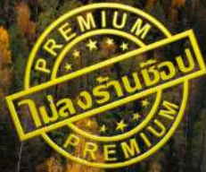
หาดห้าสี