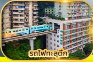
รถไฟเหาะสุดก