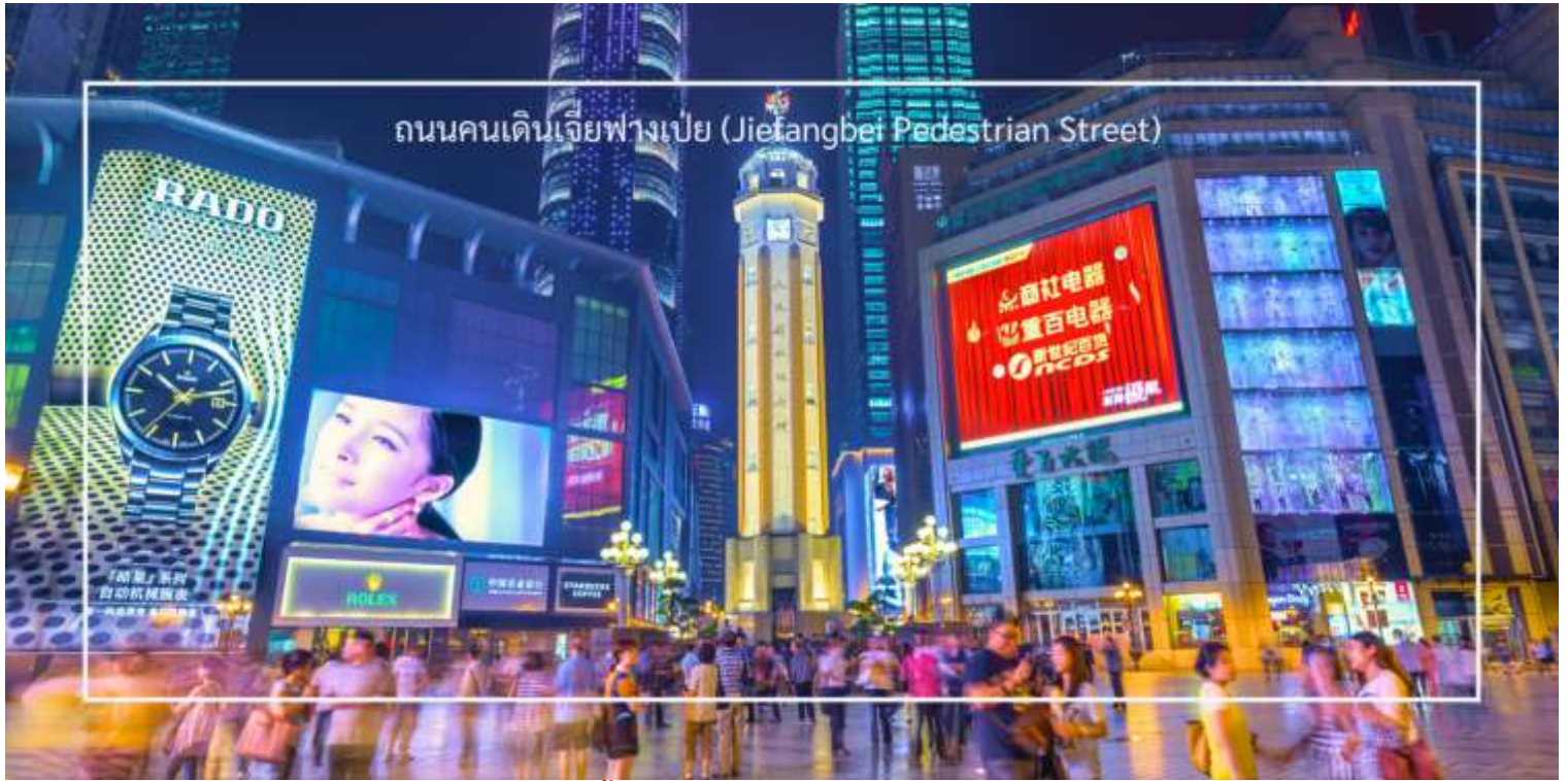
ถนนคนเดินเจี๋ยฟางเป่ย์ (Jiefangbei Pedestrian Street)