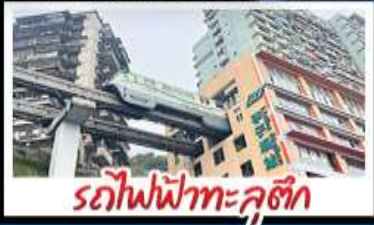
รถไฟฟ้าทะเลลึก