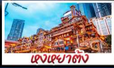
แวงเฉาตั้ง