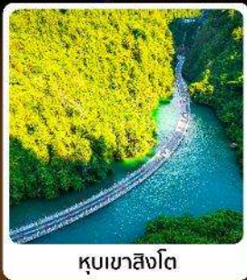
คุบเขาสิงโต

โอโห่! ปืนตรงลงเอนซือ ที่เวยเอนซือเน้นๆจัดเต็มทั่วเมือง คุบเขาสิงโต ผิงซานแกรนด์แคนยอน อุกยานจีนลี่ซาน