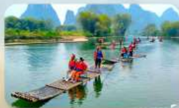
ล่องแพไม้ไผ่หยู่หลง