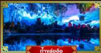
ถ้ำสุ่ยอ้อ

"ดินแดนแห่งสายน้ำและขุนเขา" สัมผัสประสบการณ์นั่งบอลลูนชมวิวมุมสูง