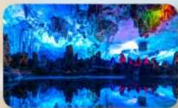
ถ้ำสุ่ยอ้อ