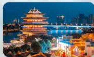
ถนนสามสายสองตรอก