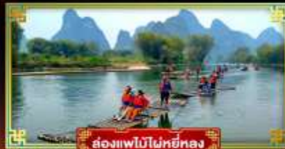
ล่องแพไม้ไผ่หยี่หลง