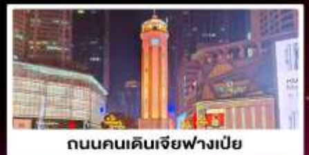
ถนนคนเดินเจียฟางเป็ย