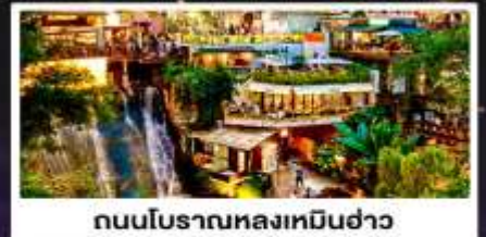
ถนนโบราณหลงเหมินฮ่าว