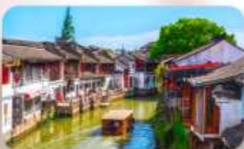
เมืองโบราณจูเจียวเจียว