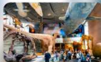
พิพิธภัณฑ์เซี่ยงไฮ้