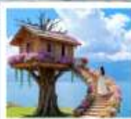
หมู่บ้านเหวินปี้

เมืองโบราณต้าหลี่ / นั่งเรือสู่เกาะเสี้ยวฉู / ซานโตรินี่ (รวมรถแบดเจอร์) / ถนนซางเอ้อร์ต้าต้า / ภูเขาอวิ๋นเซียงซาน / ต้าซ่าท่าเรือหลงกั๋ว โถง $ ทะเลสาบเอ้อไห้ / หมู่บ้านโบราณสี่จิว / หมู่บ้านเหวินปี้ / สวนดอกไม้ตามฤดูกาล