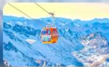
ต้ากู่ปิงชว่น