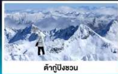
ต้ากู่ปิงชว่น