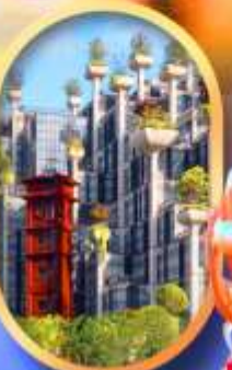
อาคาร 1,000 คับไม้