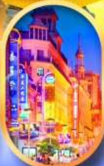
ถนนหนานกิง