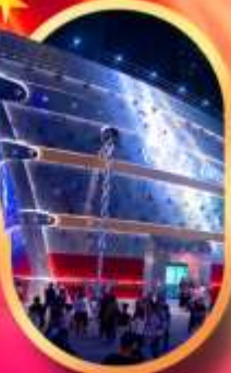
เรือเดอะหลุยส์