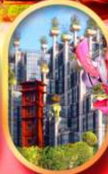
อาคารพินดิมโป้