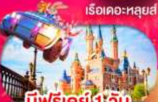
มีฟรีเคย์ 1 วัน