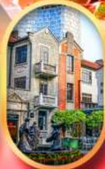
ย่านซินเกียนตี้