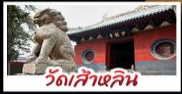
วัดสำหลิม