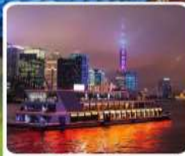
ส่องเรือแม่น้ำหวงผู่