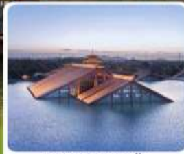
พิพิธภัณฑ์ไดน้ำ กวางฟู่หลิน