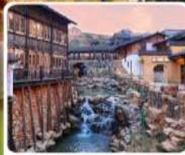
เมืองโบราณเหย้าหู