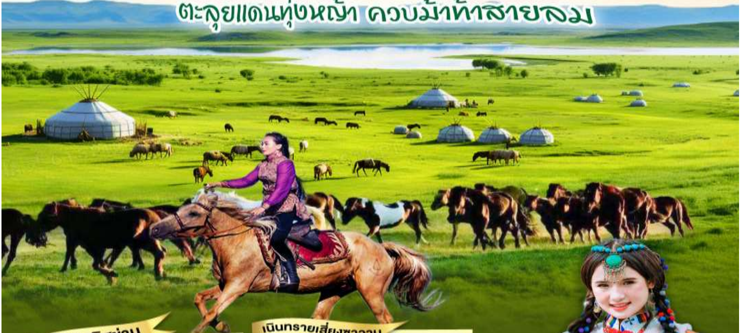
สุสานเจงกิสข่าน