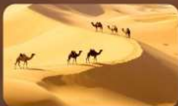
เนินทรายสี่งชวาน