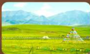
ทุ่งหญ้าออร์คอส