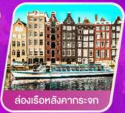
ส่องเรือสิงคารถะจก

เที่ยวเทศกาลดอกไม้เคอเคนฮอฟ ชมแคว้นอาลซัส หมู่บ้านสวยที่สุดในฝรั่งเศส เยือนเมืองมรดกโลก