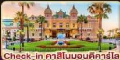
Check-in คาสีโนมอนติคาร์โล