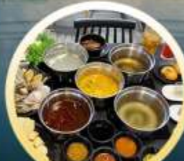
ชาบูฮ่องกง

02-04 มิ.ย. 18-20 มิ.ย. 07-09 มิ.ย. 20-22 มิ.ย. 13-15 มิ.ย. 25-27 มิ.ย. 14-16 มิ.ย. 28-30 มิ.ย.