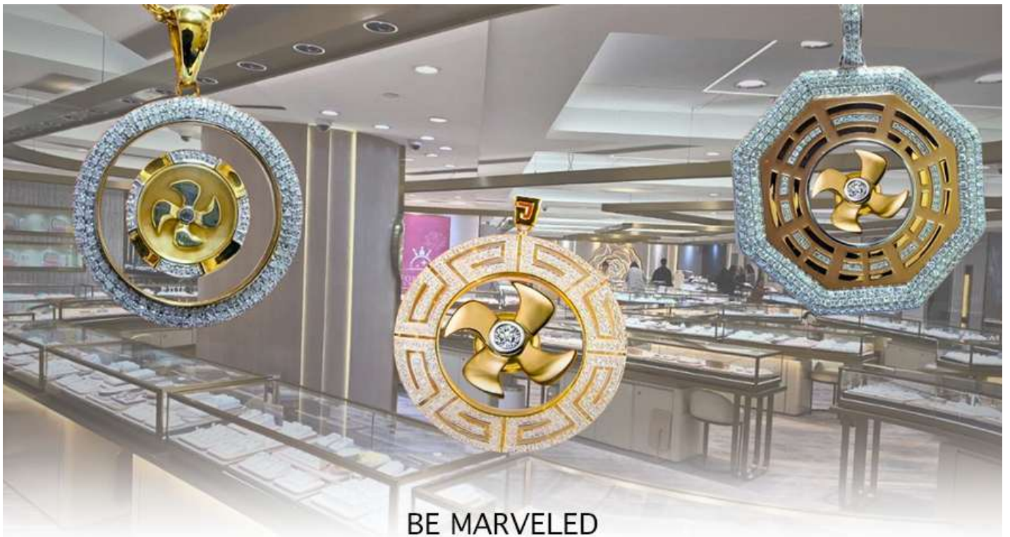
BE MARVELED ศูนย์ฮวงจุ้ย กังหันเศรษฐี

นำท่านชม ศูนย์ฮวงจุ้ย กังหันเศรษฐี ที่ขึ้นชื่อของฮ่องกง ท่านจะได้พบกับงานดีไซน์ที่ได้รับรางวัลยอดเยี่ยม และใช้ในการเสริมดวงเรื่องฮวงจุ้ย โดยการย่อใบพัดของกังหันที่เป็นสัญลักษณ์ของวัตต์แดงหงมิว มาทำเป็นเครื่องประดับ ไม่ว่าจะเป็นจี้, แหวน, กำไล หรือต่างหูเพื่อเป็นเครื่องประดับติดตัว และเสริมดวงชะตา ซึ่งสินค้าทุกชิ้นนี้ มีเอกสาร รับประกันคุณภาพเปลี่ยนหรือ ซ่อม ได้ตลอดอายุการใช้งาน หากเกิดการชำรุดจากสินค้าไม่ใช่อุบัติเหตุ