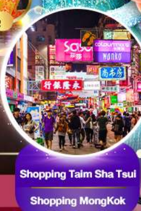
Shopping Taim Sha Tsui