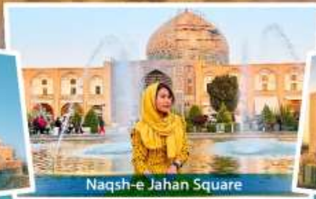
Naqsh-e Jahan Square