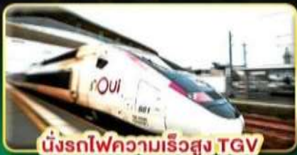
นั่งรถไฟความเร็วสูง TGV