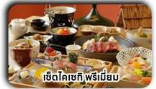
เซ็ทโคเชกิ พรีเมียม