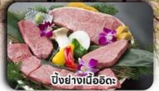
บิงย่างเนื้ออึด