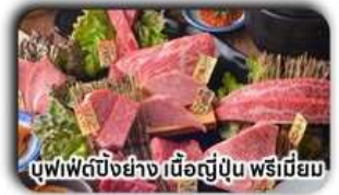
บุฟเฟ่ต์บิงย่าง เนื้อญี่ปุ่น พรีเมียม