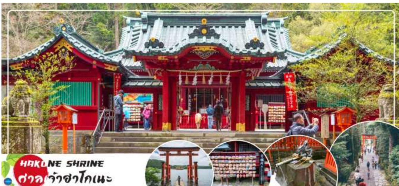
HAKONE SHRINE ศาลเจ้าฮาโกเนะ

จากนั้นนำท่าน ชมวิวทะเลสาบ 5 ศาลเจ้าฮาโกเนะ (Hakone Shrines) (ใช้เวลาเดินทางประมาณ 30 นาที) ศาลเจ้าเก่าแก่ในศาสนาชินโต ตั้งอยู่บริเวณตีนเขาฮาโกเนะ และอยู่ริมทะเลสาบอะชิ จังหวัดคานากาวา ประเทศญี่ปุ่น ไฮไลท์!!! เส้าโทริอิสี่แดง ริมทะเลสาบที่เป็นจุดถ่ายรูปยอดนิยม อีสระให้ท่านขอพรและถ่ายรูปตามอัธยาศัย