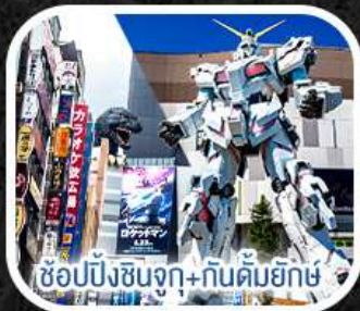
ช้อปปิ้งชินจูกุ+กันดั้มยักษ์