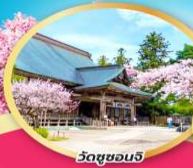
วัดชูซอนจิ