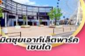
มิตซูเอากะเล็ดพาร์ค เซนได

จุดชมซากุระเริ่มต้น ฮิโตะเมะ เซ็มบง ซากุระ เริ่มต้น