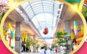
ช้อปปิ้ง ถนนอิชิบังโจ