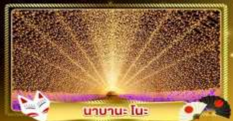
นานาโนะ โนะ