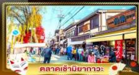
ตลาดซามิยากาวะ