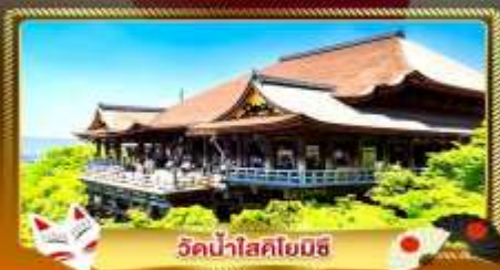
วัดน้ำใสโยมิชิ

ชมงานประดับไฟสุดอลังการ นานาโนะ โนะ ซาโตะ