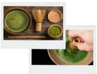
รูปภาพไฮไลท์ประกอบการโฆษณาเท่านั้น