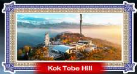
Kok Tobe Hill