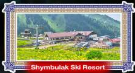
Shymbulak Ski Resort