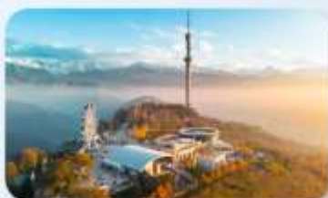
Kok Tobe Hill