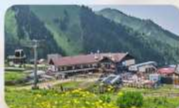
Shymbulak Ski Resort