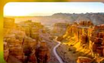
Charyn Canyon+Black Canyon