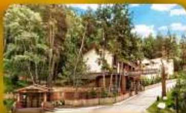
Oi-Qaragai Mountain Resort