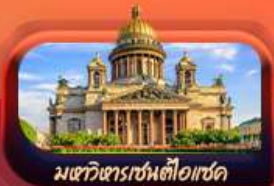
มหาวิหารเซนต์ไอแซค