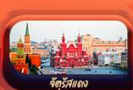
จัตุรัสแดง