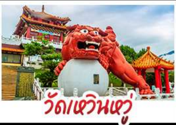
วัดเขวินเซวู

อาลีซาน - ทะเลสาบสุริยอันจินตรา - ไทเป101 วัดหวินหู้ - อนุสรณ์สถานเจียง ไคเชก วัดหลงชาน - ตลาดกลางคืนซีเหมินติง เบบู่ หมอหนึ่งจิกพรสดี - เขียวหลงเป่า - ซาบูไต้หวัน