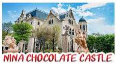
NINA CHOCOLATE CASTLE