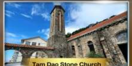
Tam Dao Stone Church