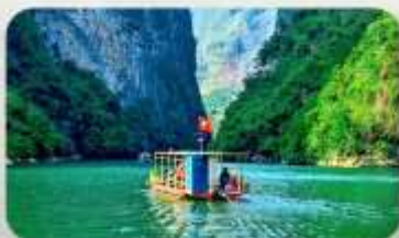
ล่องเรือ Ma Pi Leng Pass

YEN BIEN LUXURY 4* หรือเทียบเท่ามาตรฐานเวียดนาม