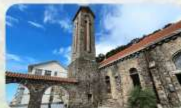
Tam Dao Stone Church