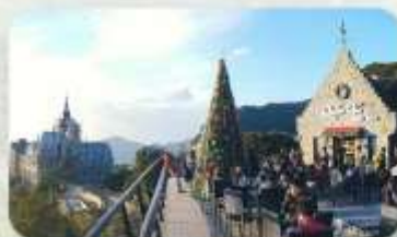
Gio Cafe Tam Dao