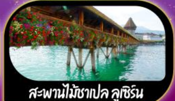
สะพานไม้ฆาปค ลูซิริน