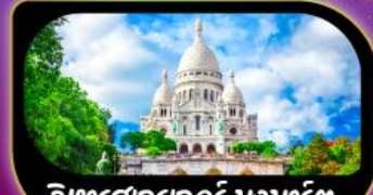
วิหารสกรเทอร์ มงมาร์ต