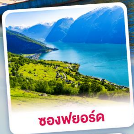
ช่องฟยอร์ด