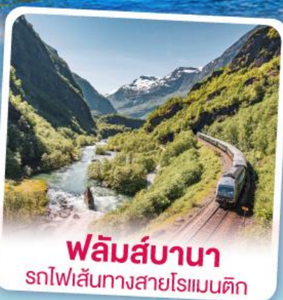
พลิမ်ส์บานา รถไฟเส้นทางสายโรแมนติก