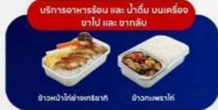
บริการอาหารร้อน และ น้ำดื่ม บนเครื่อง ขาไป และ ขากลับ