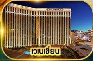
เวเนเซียน