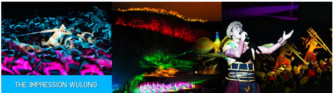
THE IMPRESSION WULONG