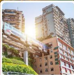
รถไฟฟ้างูตึก