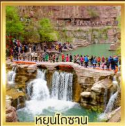
หยุ่นโกซาม