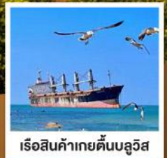
เรือสินค้าเกย์ตันบลูวีส