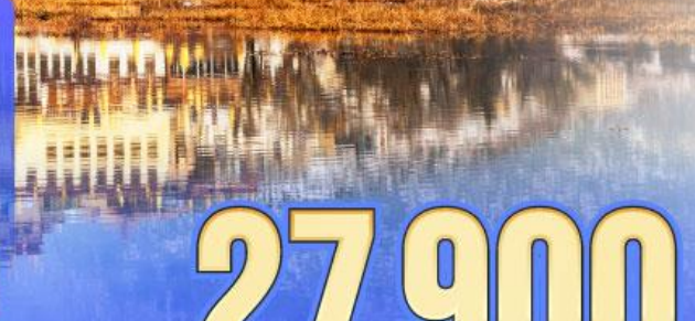
เริ่มต้น