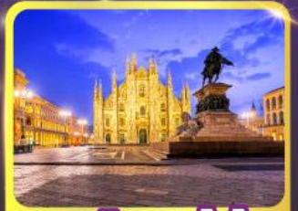
มหาวิหารคูโอโม